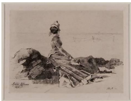
Félix Buhot Femme assise sur un rocher D'après une œuvre de Louise Abbéma Eau forte, 1874

Cet accrochage pose la question de la place de la femme dans l'art des XVIII e et XIX e siècles, à travers une sélection d'œuvres issues des collections de dessins et d'estampes du musée Thomas Henry.